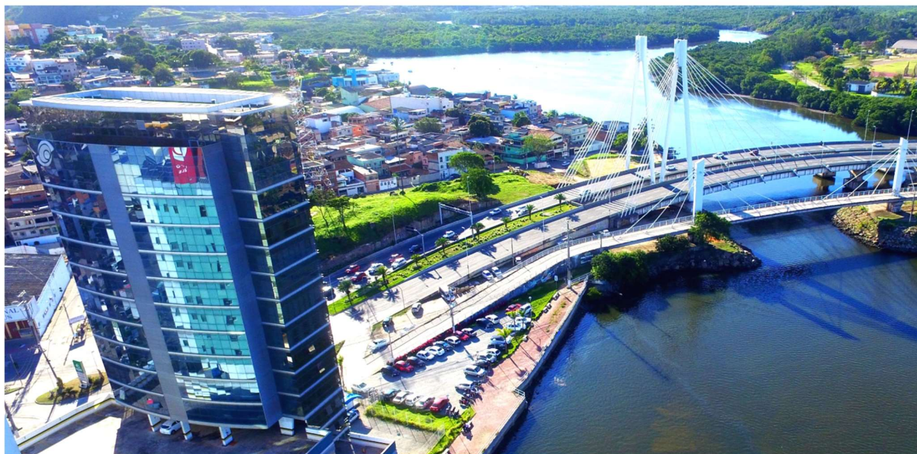
*Vista aérea do Ed. Impacto Empresarial – Sede da EG Reintegra – Vitória – ES

Tel.: 27 3024-7135 E-mail: contato@egreintegra.com Site: www.egreintegra.com CNPJ: 37.804.825/0001-79